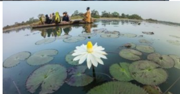
Au fil de l'eau et à la recherche des hippos (lac Tengrela - vers Banfora)