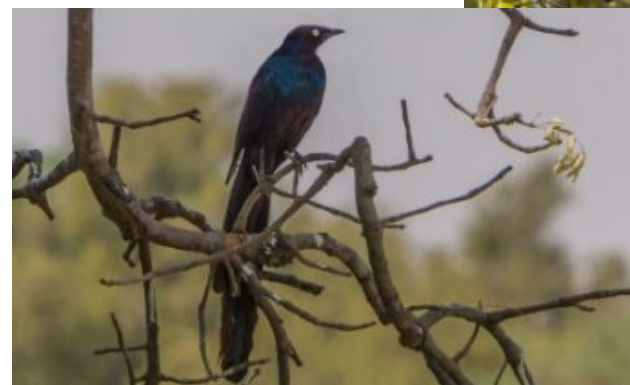
ça je sais pas... On dirait un gros merle