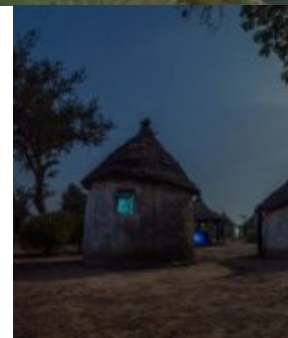
Le campement lycanthropique sous la pleine lune (Tengrela)