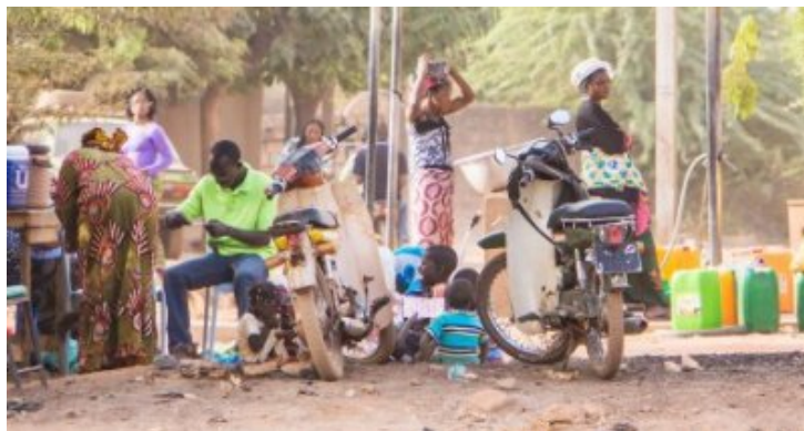
La vie est dans la rue (Ouaga)

Enfin j'ai tout de même réussi à ramener quelques clichés. voilà :