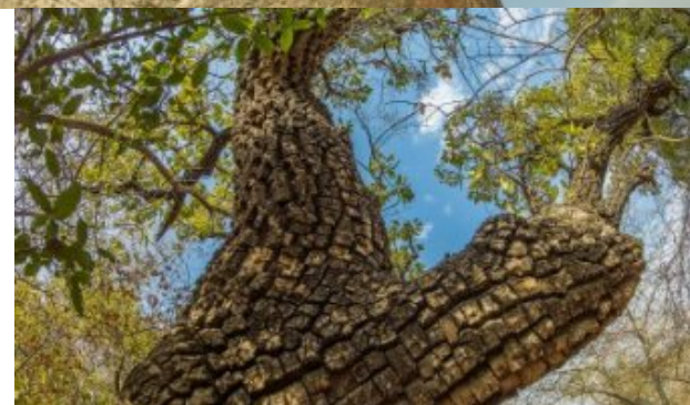
Un karité (Méséga)