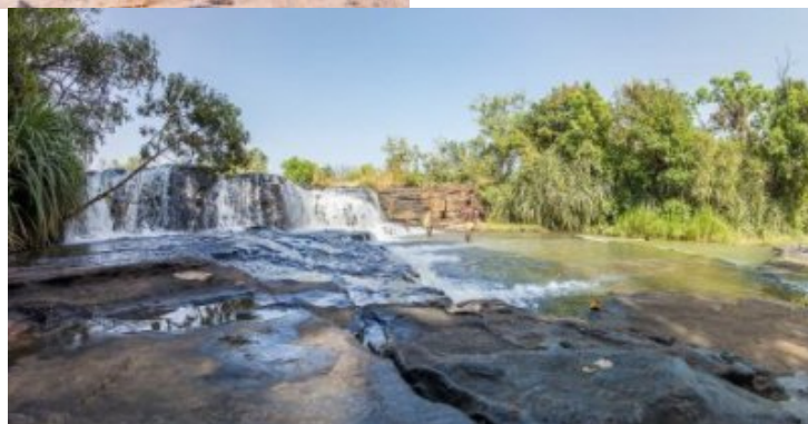
Les playboys des cascades (vers Banfora)