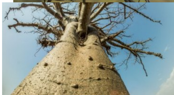
king-baobab dans les environs de Méséga