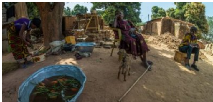
En attendant le tô (farine de mil) on croque quelques carottes (Farako Ba - Bobo)